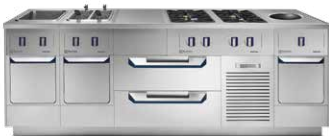
thermaline Modulare 85