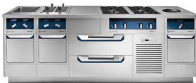
thermaline Modulare 90